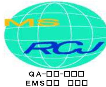
図4 登録マーク(QMSとEMSとの統合)